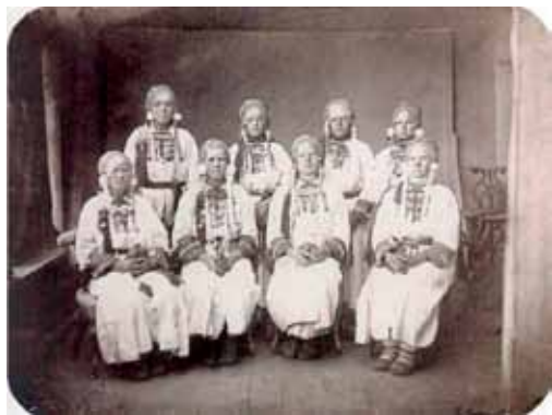
Мордва-терюхане, Терюшевская волость Нижегородской губернии

XVII век. Упоминание о селе 1693 год. В связи с переписью населения.