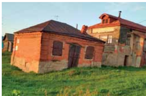
Старинная кладовая в селе Вармалей

Обходя дом, в котором мы остановились, нас очень заинтересовали резные наличники. Мы узнали, что наличники (т.е. находящиеся на лице дома) служили не только для красоты, но и были обере-