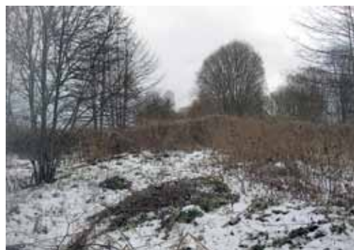
Граница между Тульской и Калужской губерниями во 2 месте, около п. Власовский, между р. Лютимка и оврагом Злобин