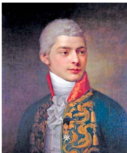
Карл Францевич (Арман-Гиньяр) Де Сен-При

низостью души, во всех альбомах притупивший, St.-Priest, твои карандаши...».