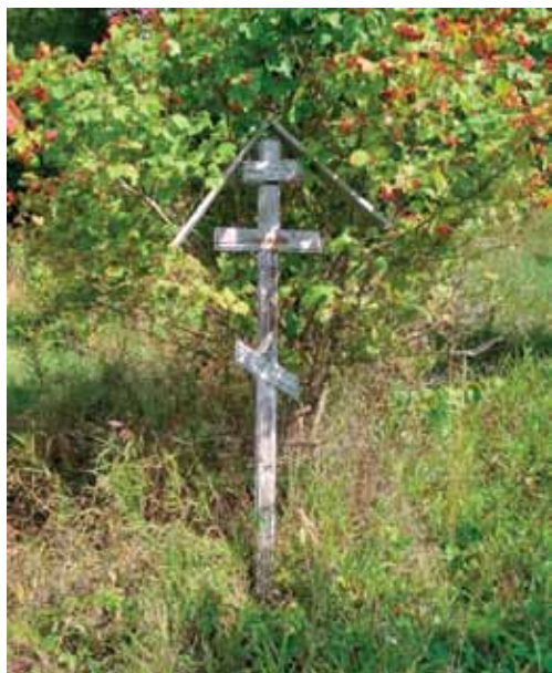
Поставленный нами крест на месте разрушенной Никольской церкви

Загадки старой Псалтири: почему такая ценная книга в обложке от учебника