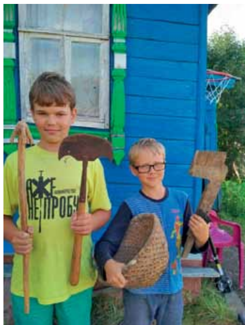
Артефакты, найденные нами на подволок

в Крыму в г. Феодосии. Чтобы еще раз подтвердить гипотезу о принадлежности находки к старинным боеприпасам надо измерить его калибр. Калибр нашего ядра равен 88мм. В таблице стандартов пушечных ядер присутствует данное наименование. Вес ядра равен 4 артиллерийским фунтам. Нам стало интересно: откуда ядро в селе? Значит там должны были быть боевые действия! Но какие? Мы знаем, что Нижний Новгород принимал участие в одном из самых крупных переворотов в России — смутном времени XVI века! Причем самое непосредственное, ведь в нем было сформировано сильное сопротивление, именуемое народным ополчением. А ядро осталось от пушек народного ополчения, захваченных или полученных другим образом. По данным источников, в районе Дальнеконстантиново действительно было народное ополчение, более того, там были настоящие сражения в сосед-