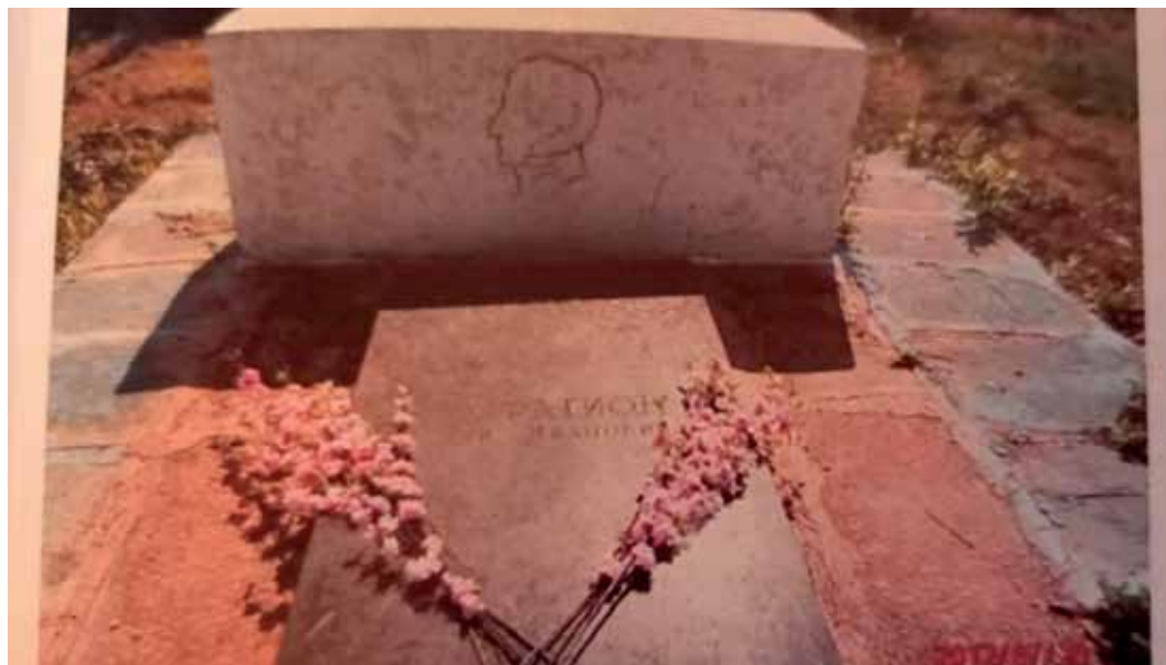
Могилы П.И. Багратиона с. Сима

Так я стал участником первого своего похода. Велопохода, точнее. Движение на дорогах было, конечно, не такое, как сейчас. Редко когда машина проедет. Мы ехали по обочинам дорог, по