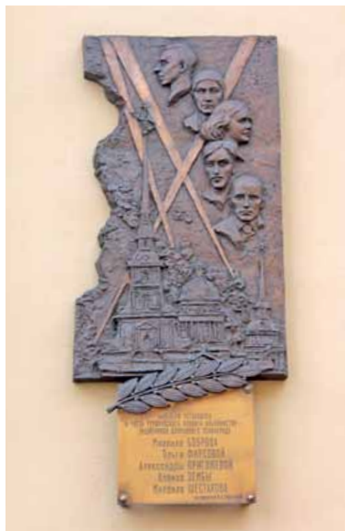
Барельеф на стене Петропавловского собора с именами блокадных альпинистов

Уже в июле 1941 года была создана специальная служба технической маскировки города. Маскировочной сеткой был укрыт Смольный, где располагался военный совет-сердце и мозг обороны города. Огромные футляры из мешков с песком укрыли памятники: Медный всадник, С.М. Кирову, В.И. Ленину у Финляндского вокзала и др. Сняли с постаментов конные скульптуры П.К. Клодта у Аничкова моста и памятник Петру Первому у Михайловского замка. Не укрытыми остались только монументы великих русских полководцев Суворова, Кутузова и Барклая де Толли, которые вдохновляли защитников города-воина. На стенах домов появились надписи «При артобстреле эта сторона улицы наиболее опасна». У немецких артиллеристов в планшетах нашли фотографии панорамы города,