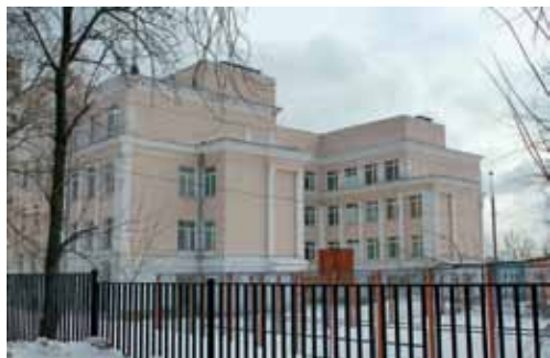
Западный комплекс непрерывного образования (ул. Гродненская, д.5)

языку. Сейчас в этом здании по адресу: улица Гродненская, дом 5 находится одно из отделений Западного комплекса непрерывного образования, куда входит сейчас школа «три восьмерки» и где я продолжаю свое образование уже как ученица 10 класса.