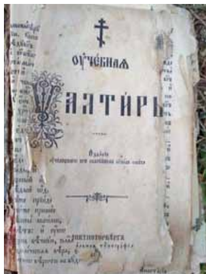
Псалтирь 1884 года (ориентировочно), найденная нами на подволоке

арифметики и почему она спрятана на подволоке? В каком году была выпущена эта Псалтирь?