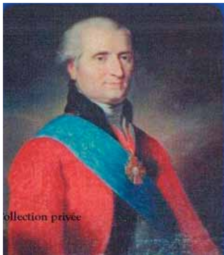
Виконт Франсуа-Эммануэль (Гиньяр) де Сен-При