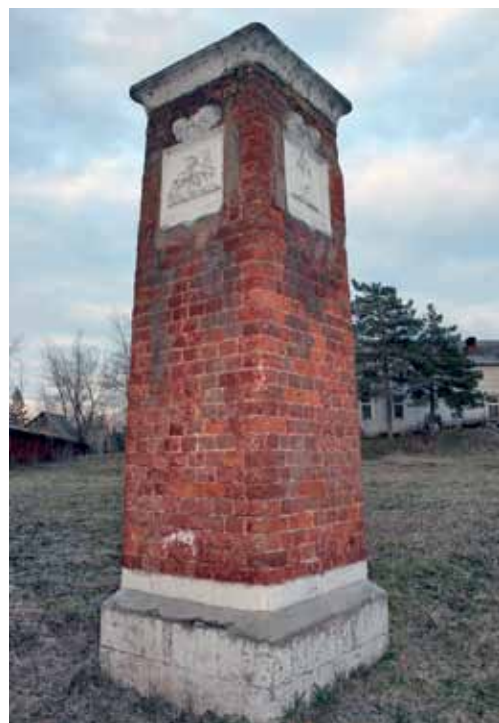
Пограничный столб между Московской и Рязанской губерниями на окраине г. Коломны

По письменным источникам удалось выяснить, когда был поставлен пограничный столб между Тульской и Калуж-