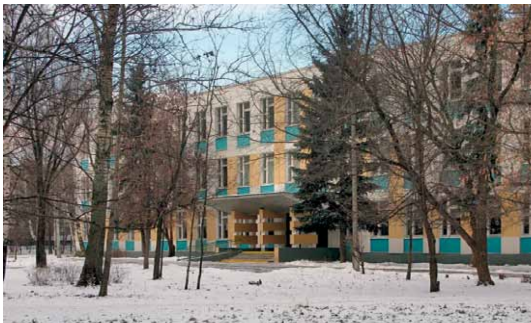
Школа № 888 (ул. Ращупкина, д.3)

Нам было очень приятно познакомиться с этой работой и еще раз поблагодарить школу 1476 которая выпустила книгу «Танковые асы» – эта книга помогла автору глубже проникнуть в эту работу.