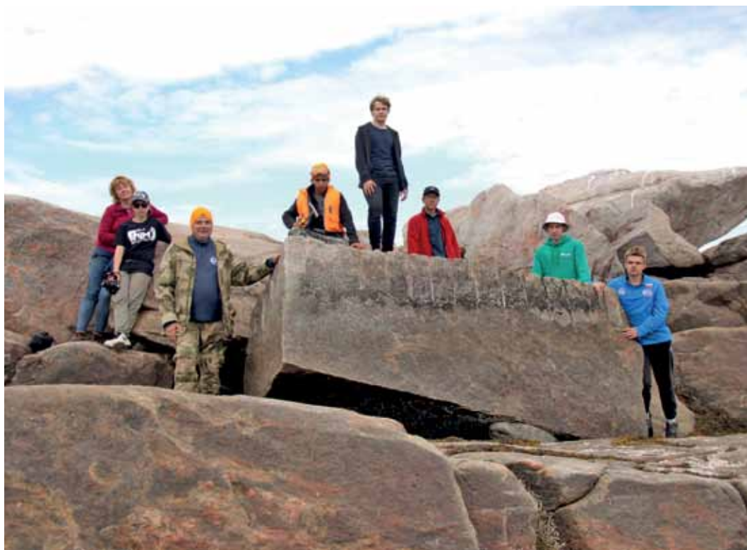
Команда клуба «Наша Арктика» на месте проведенного исследования, июль 2023 г.

На самом о. Пневатый лежат 6 овальных природных плит шириной 2–2,5 м, расколотых по середине, но не разъятых. Либо эти плиты были расколоты перед самым закрытием скита в 1918 году, либо использовались как «учебные пособия» начинающим каменотесам. Других мест, где велась бы интенсивная колка камня, на Кондострове не выявлены. По всей видимости, о. Пневатый, связанный с Кондостровом обширной обсыхающей литоралью и есть знаменитая «Кондостровская каменоломня», встречающая-