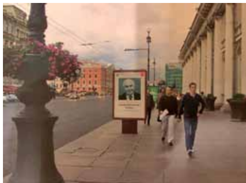
Санкт-Петербург. Невский проспект