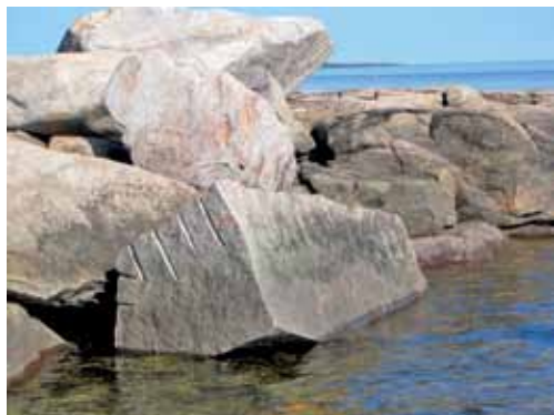
Гранитный блок, оставшийся на месте обработки будущего постамента.

ски вплотную. Исследование кромки осколка показало совпадение с такой на старой фотографии. В одном из просверленных отверстий сохранились