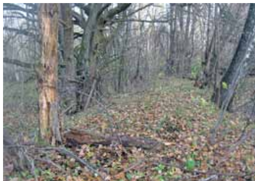
Граница между Тульской и Калужской губерниями в 1 месте, около д. Ходыкино Белёвского района. Фото 2023 года

участка границы: 53.836803; 36.078546. Эта граница начиналась на левом берегу реки Волкуши, от устья её левого притока — оврага Волкушевский и шла в северном направлении до верховья оврага Кушинка, состоявшего из 2 вершин, правого притока реки Лютимки. Данная граница на местности полностью совпадает с границей между губерниями, отмеченной на карте Генерального межевания Белёвского уезда в 1792 году.