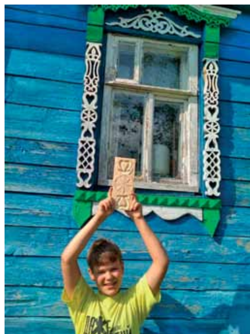
Старинные наличники и работа автора проекта