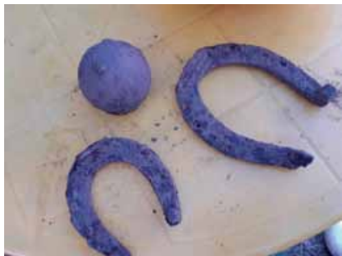
Найденные подковы и ядро

них села Большое Терюшево и Помра. Там мы нашли памятники этим боевым действиям, а село Вармалей находится от Помры в 5 минутах езды! Первый памятник в селе Большое Терюшево. В селе было сражение в 1608 году, в самый разгар смутного времени. В селе Помра было сражение несколькими годами позже. Это означает, что вооружение могло оставаться в селах несколько лет, на случай нового удара. Как минимум, одно из этих событий затронуло ближнее село Вармалей. Анализ исторической литературы показал, что первый этап Смуты, связанный с появлением и воцарением Лжедмитрия-I, обошел Нижегородские края стороной. Ситуация изменилась, когда после убийства первого самозванца бояре без созыва представителей всей земли наспех провозгласили царем князя Василия Ивановича Шуйского. Ответом стал отказ многих регионов признавать власть боярского царя. Часть людей взялась за оружие — это так называемое движение Болотникова. Фигурой, которая начала притягивать всех недовольных, стал Лжедмитрий II, обосновавшийся в Тушине. В результате по всей стране разлился огонь самой настоящей гражданской войны.