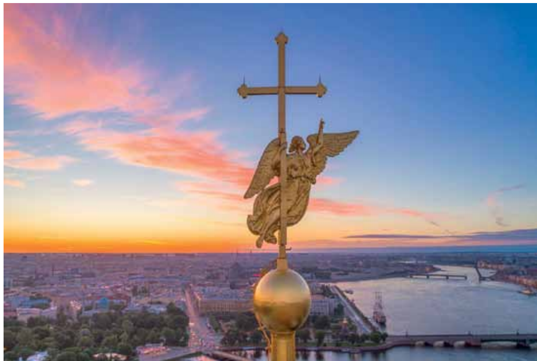
Ангел на шпиле Петропавловского собора

80-летию полного освобождения Ленинграда от вражеской блокады посвящается