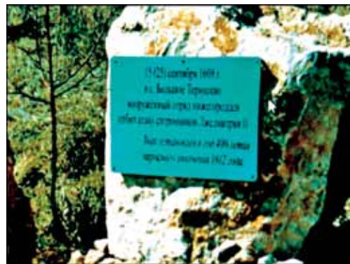
Памятник расположенный в селе Большое Терюшево