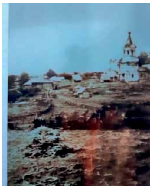
Никольская церковь села Вармалей в XIX веке (копия фото из Дальнеконстантиновского краеведческого музея)