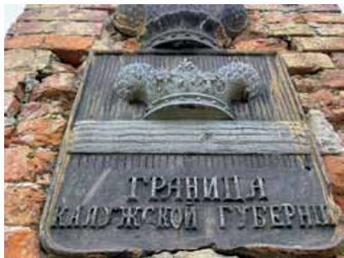
чугунный герб Тульской губернии на пограничном столбе

• выявить и ознакомиться с письменными источниками, в которых упоминается разграничение между Тульской и Калужской губерниями,