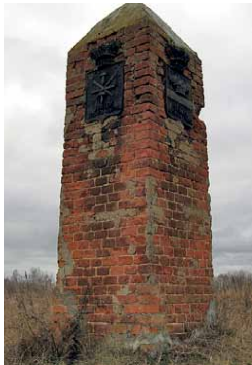
Пограничный столб между Тульской и Калужской губерниями

• собрать и проанализировать сообщения местных жителей об остатках