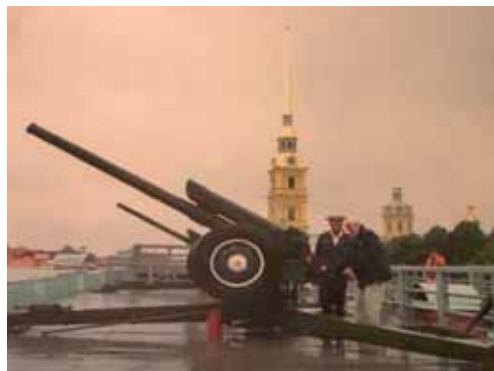
Петропавловская крепость. Полуденный выстрел из пушки

человека, членом Всемирного клуба петербуржцев, членом Попечительского Императорского Петропавловского собора, членом множества важных и нужных общественных организаций, советов.