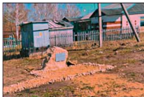
Памятник в с. Помра