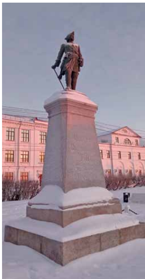
Памятник Петру Великому в Архангельске.

русской истории. Здесь, в 1693 году, юный царь впервые увидел настоящее море, взобрался на борт настоящего морского корабля, совершив на нем путешествие до берегов Мурмана. Пле-