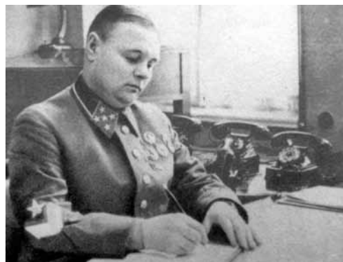
Мерецков Кирилл Афанасьевич

В соответствии с Указом Президиума Верховного Совета СССР №605/104 от 17 декабря 1941 года звание Героя Советского Союза было присвоено пятерым