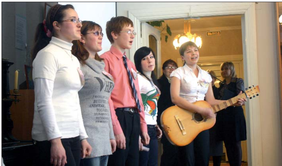
Вот так мы начинали. Историческая библиотека Дома Романовых, г. Кострома, февраль 2011 г.

ной информации получаешь при глубоком изучении вопроса! Основной ход военных событий, личности генералов — героев войны 1812 года, литература, живопись, музыка, посвященная Отечественной войне, земляки-костромичи, участвовавшие в ней — всё это безумно интересно!