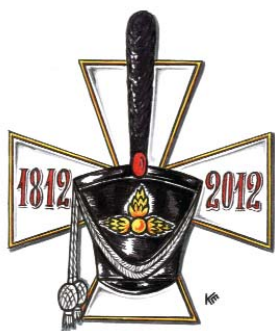
Эмблема к 200-летию Бородинского сражения. Художник Е. Комаровский

Ежегодно в нашей стране проводится конкурсовикторина «Дорогами 1812 года». В 2011 году мы, ученики Спасской школы, решили поучаствовать в ней. Команду назвали «Патриоты». С энтузиазмом взялись за дело! Все вместе усиленно искали ответы на непростые вопросы первого тура викторины. И старания наши не пропали даром — мы прошли во второй тур, эта новость удивила и обрадовала нас. Впереди было много работы — углублять знания по войне 1812 года. Столько интерес-