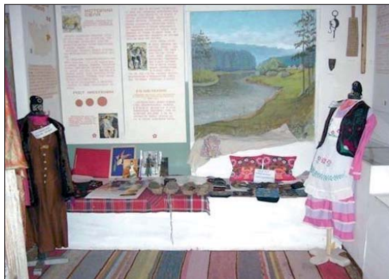
Экспозиция нашего школьного музея

Светским наукам (географии и основам математики) в селе Индерка впервые стали обучать в 1910 году. В 1913 году в Индерке открыли земскую школу на 50 человек. А в 1940 году открывается средняя школа,