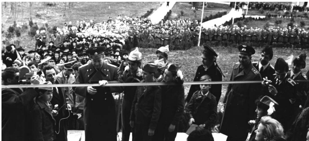
1969 год. Открытие Дома авиации и космонавтики. Лётчик-космонавт А.А. Леонов разрезает алую ленту

ский значок в космос?» Космонавт ответил: «Да!»