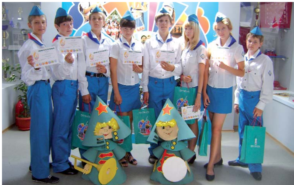
Юные экскурсоводы музея истории ВДЦ «Орлёнок»

Ребята заглядывают в недра Вселенной и узнают, как рождаются и умирают звёзды, знакомятся с космическими чудесами: туманностями, звёздными скоплениями, галактиками, квазарами, белыми карликами, нейтронными звёздами и чёрными дырами. Постигая мир неизведанного, орлята учатся мечтать, экспериментировать, выдвигать свои гипотезы, размышлять о вполне серьёзных, взрослых космических проблемах.