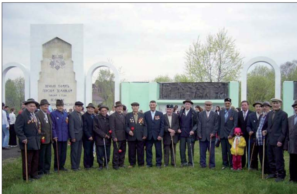
Ветераны села Индерка

которая делает первый выпуск в 1943 году.