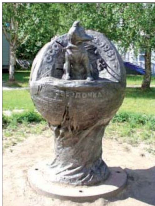
Памятник собаке Звёздочке, г. Ижевск

путь: взлет, виток вокруг Земли и посадка.