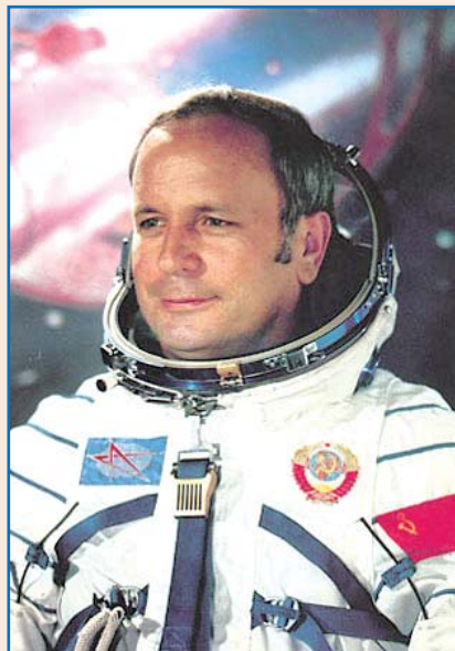
Лётчик-космонавт В.В. Горбатко

3 декабря 1934 года — родился в поселке Венцы-Заря Кавказского района Краснодарского края. Детство, школьные годы, юность прошли в поселке конезавода «Восход» Новокубанского района Краснодарского края.