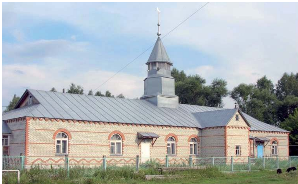
Мечеть в селе Индерка