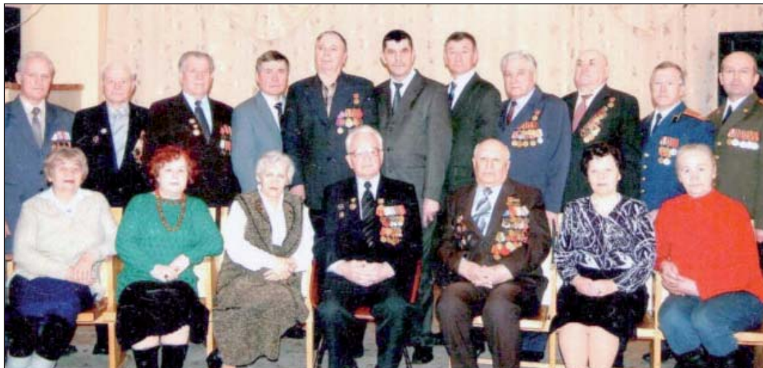
Совет ветеранов поселка Смолино.