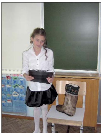
Валерия Большова, автор

Само слово «унты» эвенкийского происхождения. Так эвенки называли короткую обувь, украшенную кусочками меха, бисером, кожей. Унты делали из камуса — наиболее прочной части оленьей шкуры, которую брали с ног животных, от колен до копыт. В условиях суровой тайги эвенки веками использовали эту обувь. Она была разного назначения: кулпикэ — весенне-осенние унты до колен, купури — зимние меховые унты, бакари — зимние высокие меховые унты с орнаментом из меха и бисера, локомил — короткие летние унты из замши, олочи — короткие рабочие унты на меховой подошве с разрезом спереди.