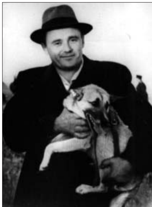
С.П. Королёв с подопытной собакой, Капустин Яр, 1951 г.

И очередная попытка наконец-то оказалась удачной. 19 августа 1960 года «космонавты» Белка и Стрелка в компании мышей, насекомых и растений вырвались за пределы атмосферы. Теперь вся эта живность находилась в катапультируемом отсеке, рассчитанном на приземление с помощью парашюта.