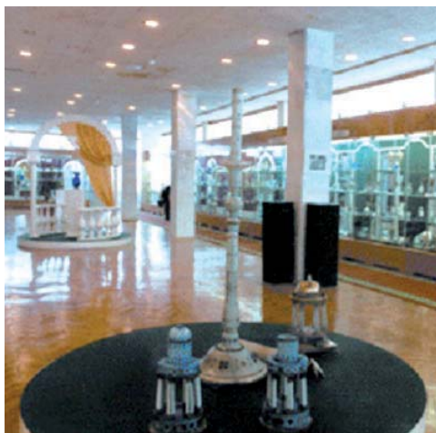
Музей стекла и хрустала, г. Никольск

Одной из главных достопримечательностей нашего города Никольска является Музей стекла и хрустала.