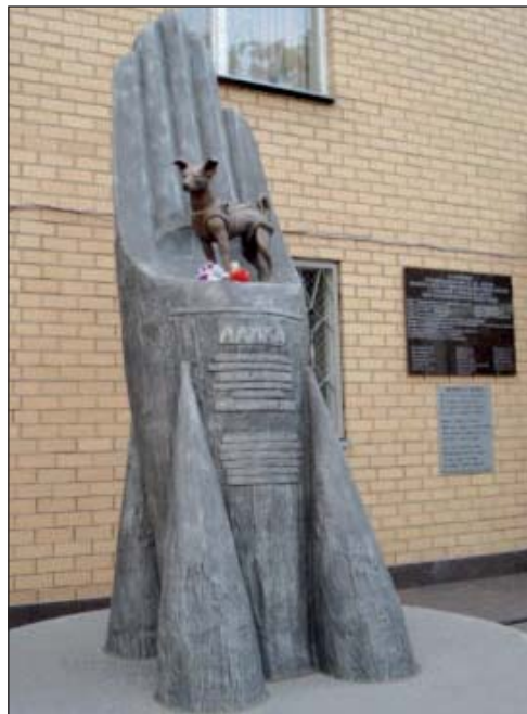
Памятник собаке Лайке, г. Москва

Памятник еще одной собаке — Звездочке — был открыт в Ижевске