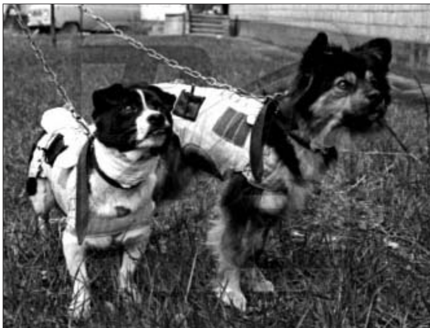
Дезик и Цыган

Использовать собак в качестве пассажиров ракет, летающих в стратосферу, советские ученые начали под руководством главного конструктора С.П. Королева еще в июле 1951 года. Первыми участниками этих экспериментов были псы Дезик и Цыган , которые поднялись в ракету на высоту 100 км. Запуск состоялся 22 июля 1951 года в 4 часа утра с полигона Капустин Яр.