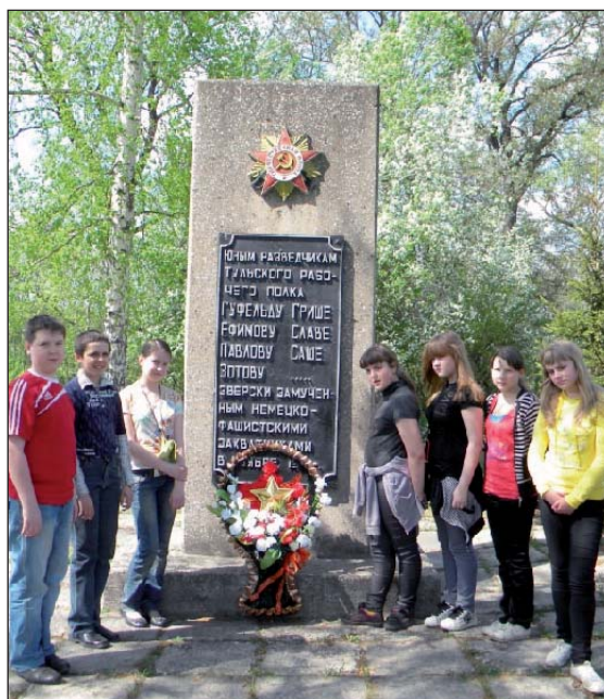
Ребята из клуба «Русич» у обелисков, поставленных в честь героев Великой Отечественной войны

Использованы материалы газет: «Дзержинец», «Косогорец», «Молодой коммунар».