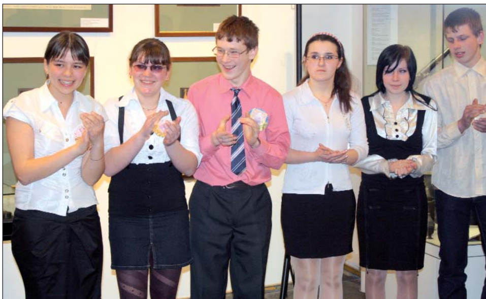
Наша команда. Мы победители! Москва, Музей-панорама «Бородинская битва»