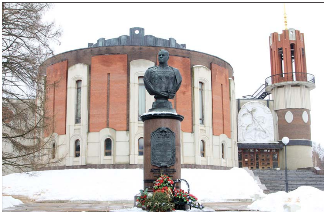
Музей Г.К. Жукова

Музей находится в районном центре Калужской области — г. Жукове. В трёх километрах от города — деревня Стрелковка, где 1 декабря 1896 года родился будущий полководец, маршал Советского Союза.