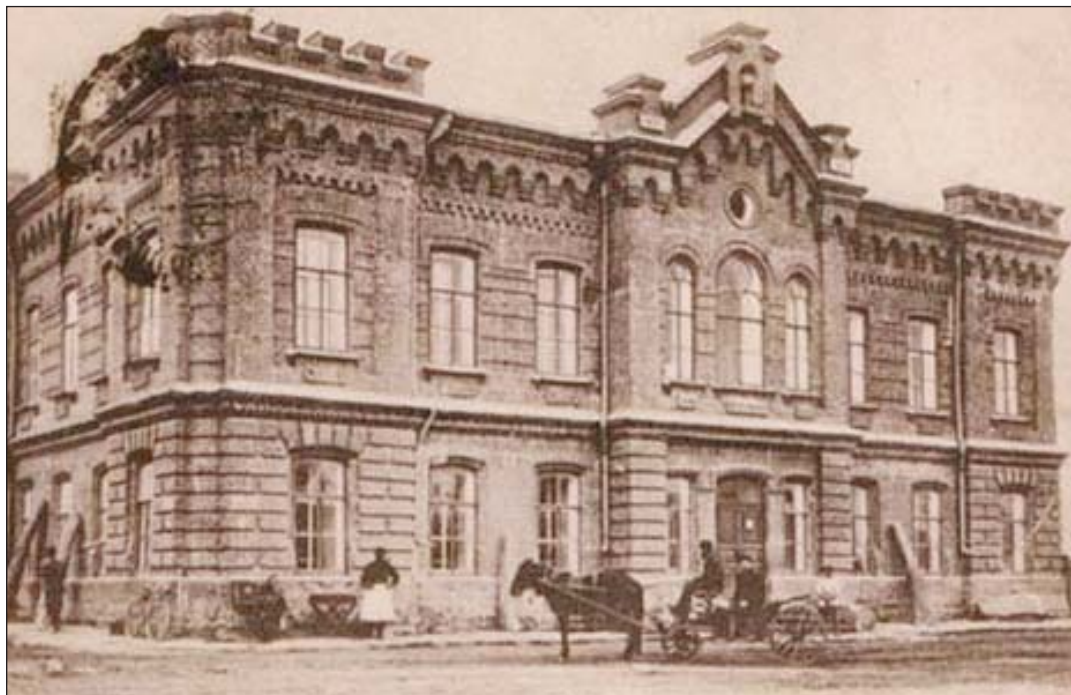
Городской Мартьяновский музей, г. Минусинск

от известных ученых и путешественников (Г.Н. Потанин, Н.М. Ядринцев, Ф.Я. Кон, В.В. Радлов, В. Томсон и др.) до простых сельских учителей, священников. За консультациями в музей обращались профессора из Томска, Москвы, Петербурга, Дерпта, Гельсингфорса, Кракова, Красноярска и других городов, а также практики-предприниматели, земледельцы, ремесленники. При музее, со дня его основания, имелась публичная научная библиотека, которая к 1901 году имела 25 тыс. томов.