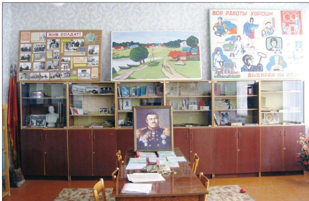
В кабинете Нивнянской школы