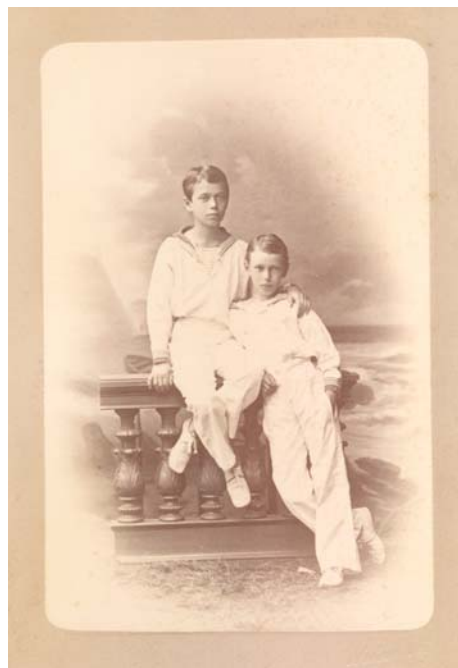
Цесаревич Николай (слева) и его брат Великий князь Георгий

Много документов, дневников хранится в архиве Русского географического общества. В 1989 г. наша семья передала на государственное хранение медали и альбомы с фотографиями. У нас в семье долгое время хранилась одна старинная фотография, на которой запечатлены двое подростков. Нас постоянно мучили вопросы: кто эти юноши, почему это фото оказалось в семейном альбоме. Однажды эта загадка разрешилась. Моя жена смотрела передачу, посвящённую династии Романовых. Там неожиданно промелькнула точно такая же фотография. Оказалось, что это сыновья Александра III — юный Николай II со своим братом Георгием. Будущий наследник престола с почтением относился к нашему