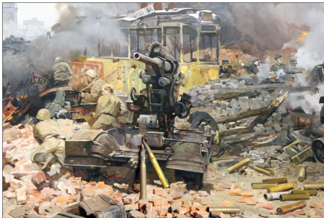
Диорама «Битва за Берлин»