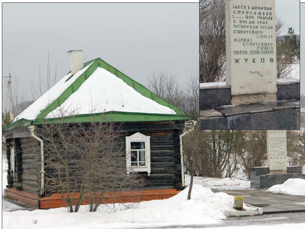
Копия дома Жуковых

го не наказывал и никогда не повышал голоса на ребят. Ученики его уважали и слушались»).