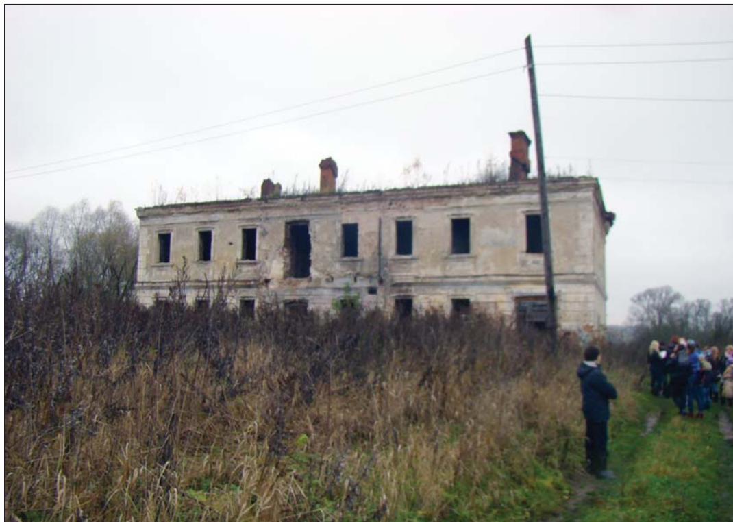
Флигель в усадьбе Н.И. Новикова

ностью в Петербурге. Именно Новикова называют первым журналистом России. Издавал занимательные сатирические журналы: «Трутень», «Пустомеля», «Живописец», «Кощелёк».