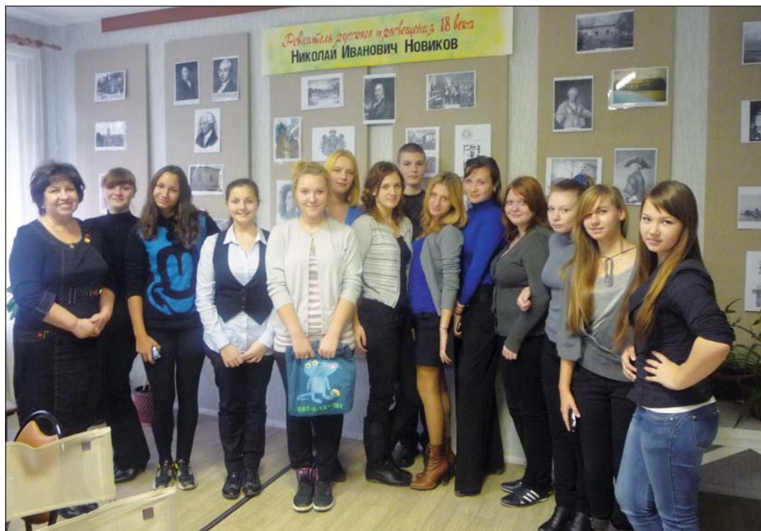
Участники краеведческой программы «Времена. События. Люди». Н.И. Новиков

ученое общество», которое должно было заниматься изданием полезных дел, помогать отцам в воспитании детей и поощрять к образованию молодых людей. Одним из главных направлений деятельности общества стало расширение издательской деятельности.