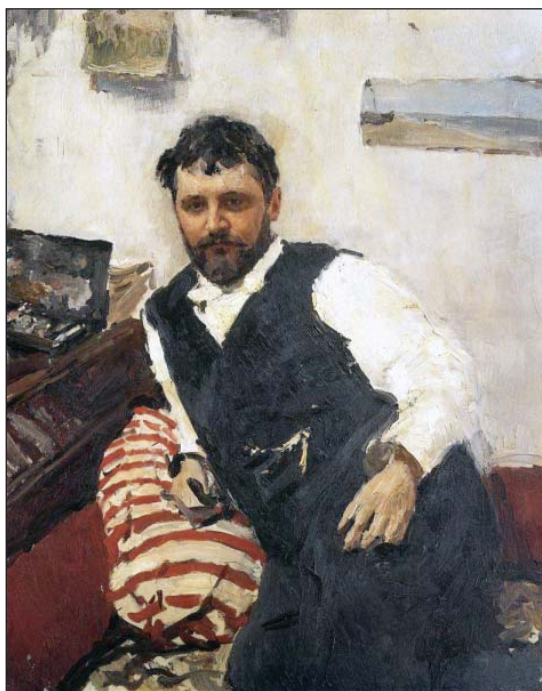
Портрет К.А. Коровина. Худож. В.А. Серов. 1891

Художник Константин Алексеевич Коровин (1861–1939) родился в Москве на Рогожской улице в доме своего деда Михаила Емельяновича Коровина, купца первой гильдии. Район бывшей Рогожской слободы с частично сохранившейся старой застройкой находится рядом со станцией метро «Площадь Ильича». В своих воспоминаниях К. Коровин пишет: «Я помню прекрасный дом деда на Рогожской улице. Огромный особняк с большим двором; сзади дома был огромный сад, который выходил на другую улицу, в Дурновский переулок. И соседние небольшие деревянные дома стояли на просторных дворах, жильцами в домах были ящики. А на дворах стояли конюшни и экипажи разных фасонов, дормезы, коляски, в которых возили пассажиров из Москвы по арендованному у правительства дедом дорогам, по которым он гонял ямщину из