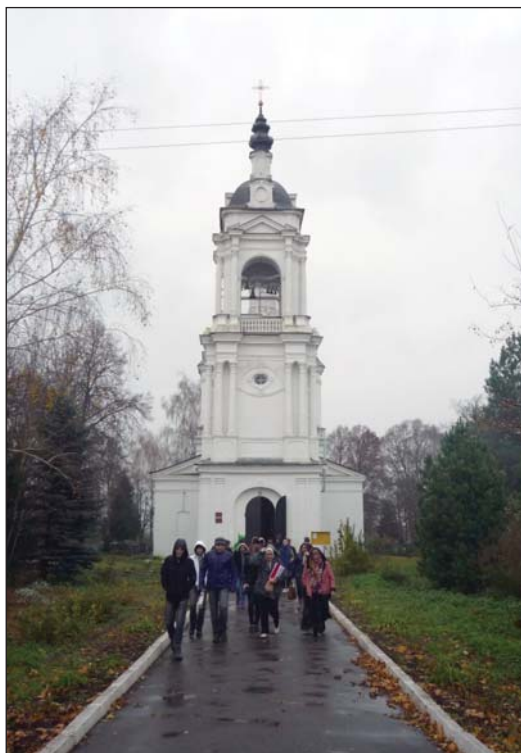
Тихвинский храм. Место захоронения Н.И. Новикова, с. Авдотьино