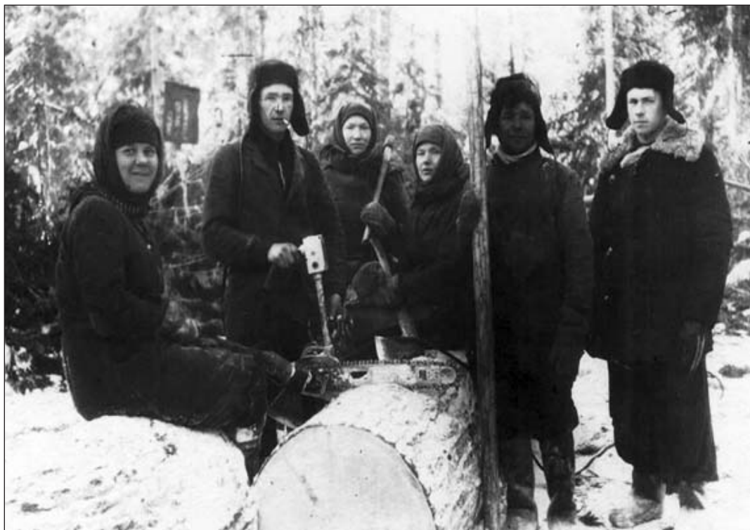
Бригада местных жителей на заготовке лесоматериалов. 1950 г.