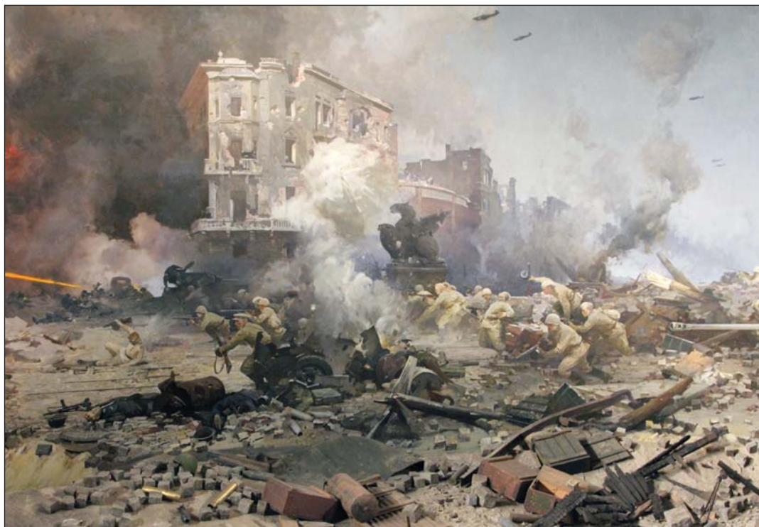
Диорама «Битва за Берлин»

тов занимает письменный стол, за ним Жуков работал над своими воспоминаниями. Большой интерес посетителей вызывают витрины с помещёнными в них личными вещами Георгия Константиновича: сапоги, в которых он принимал Парад Победы в 1945 году, форменная одежда, спиннинг и ягдташ — память о любимых занятиях Г.К. Жукова, охоте и рыбалке... И таких вещей много в музее. У каждой из них своя интересная история.